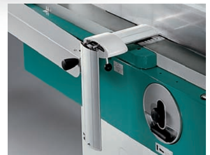
Standard (PF 430-PF 530) - Option (PF 530R) Two-side folding spindle safety guard "CE" "CE" Zweiteilige Hobelwellschutzabdeckung Базовая комплектация (PF 430-PF 530) Опция (PF 530R) Защитное устройство CE, складывающееся пополам