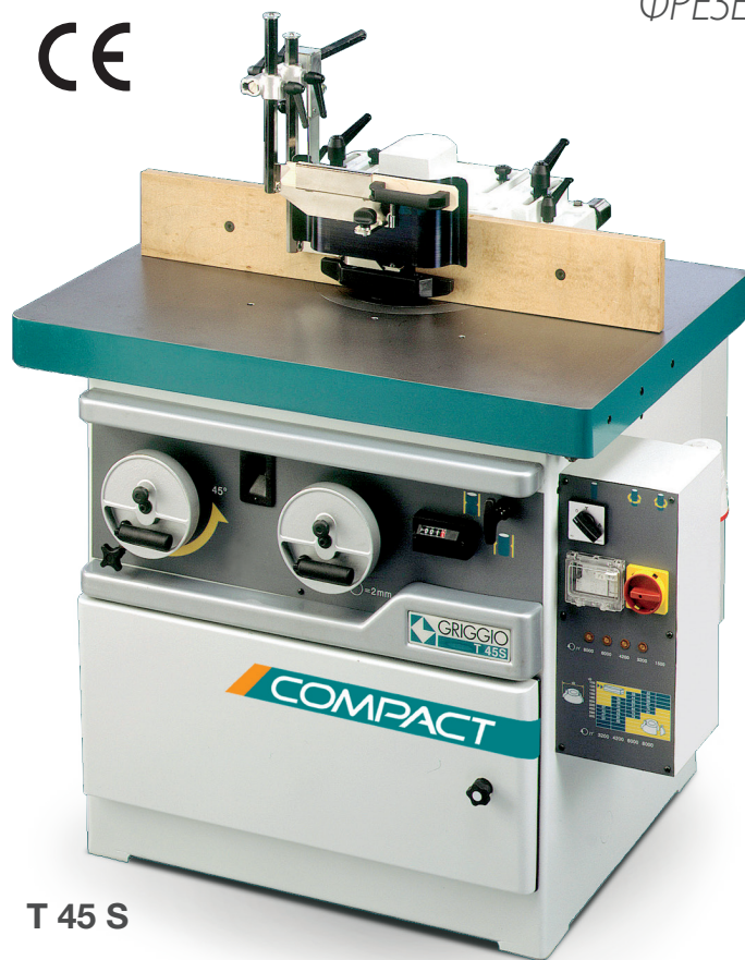
T 45 S