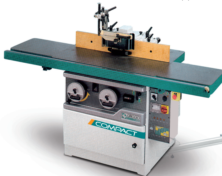
T 45S - TPL