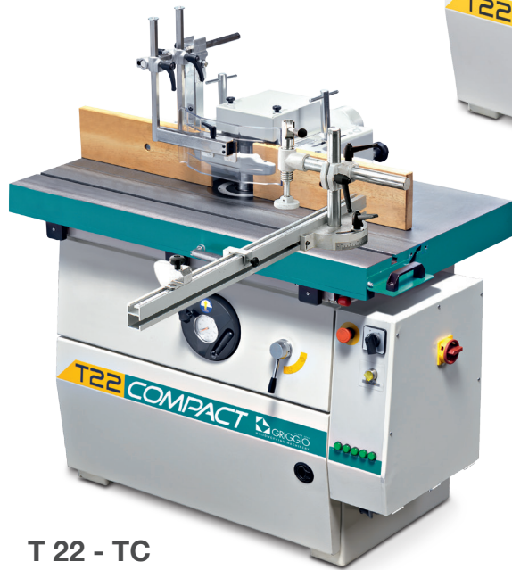
T 22 - TC