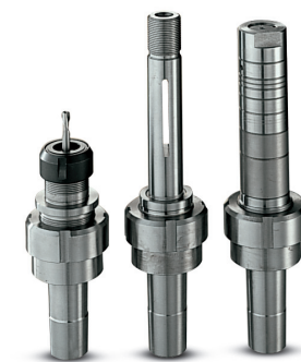
OPTION MK5 interchangeable shaft Austauschbare Spindel MK5 Сменный шпиндель MK5