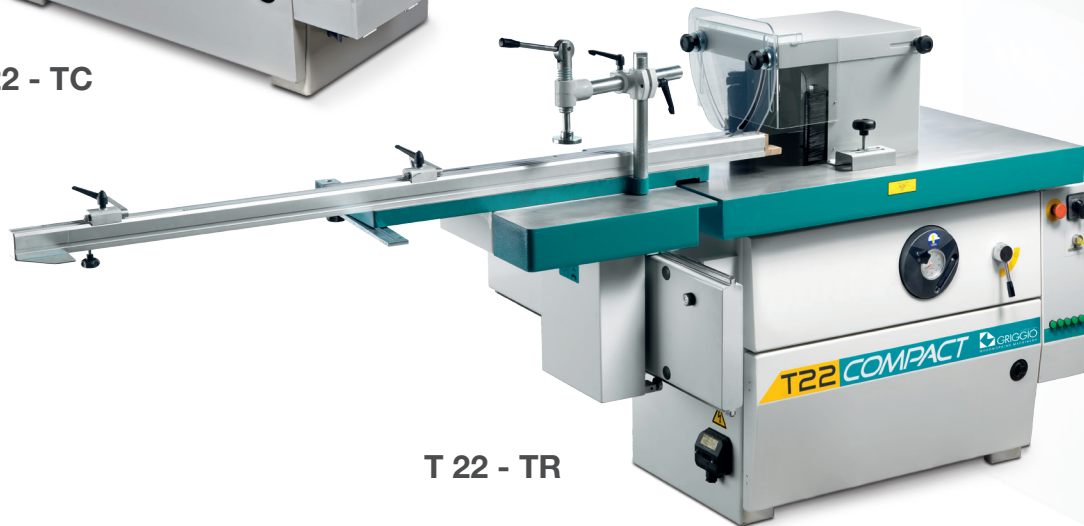
T 22 - TR