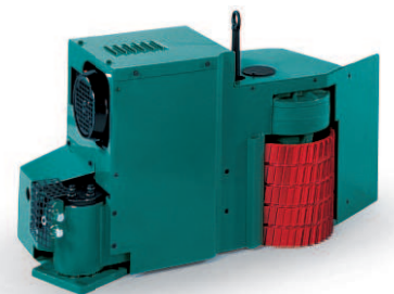
RA 15 RA 21 Option