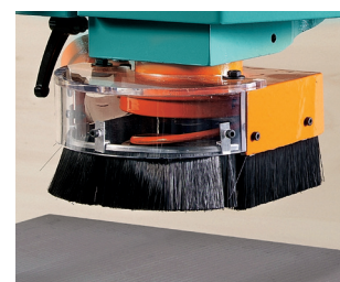
Option Basic Standard CE