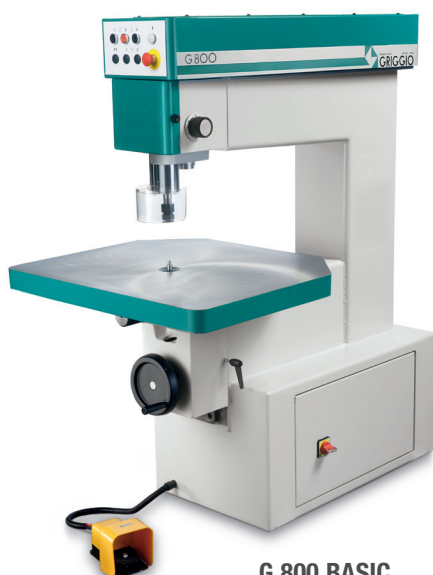
G 800 BASIC