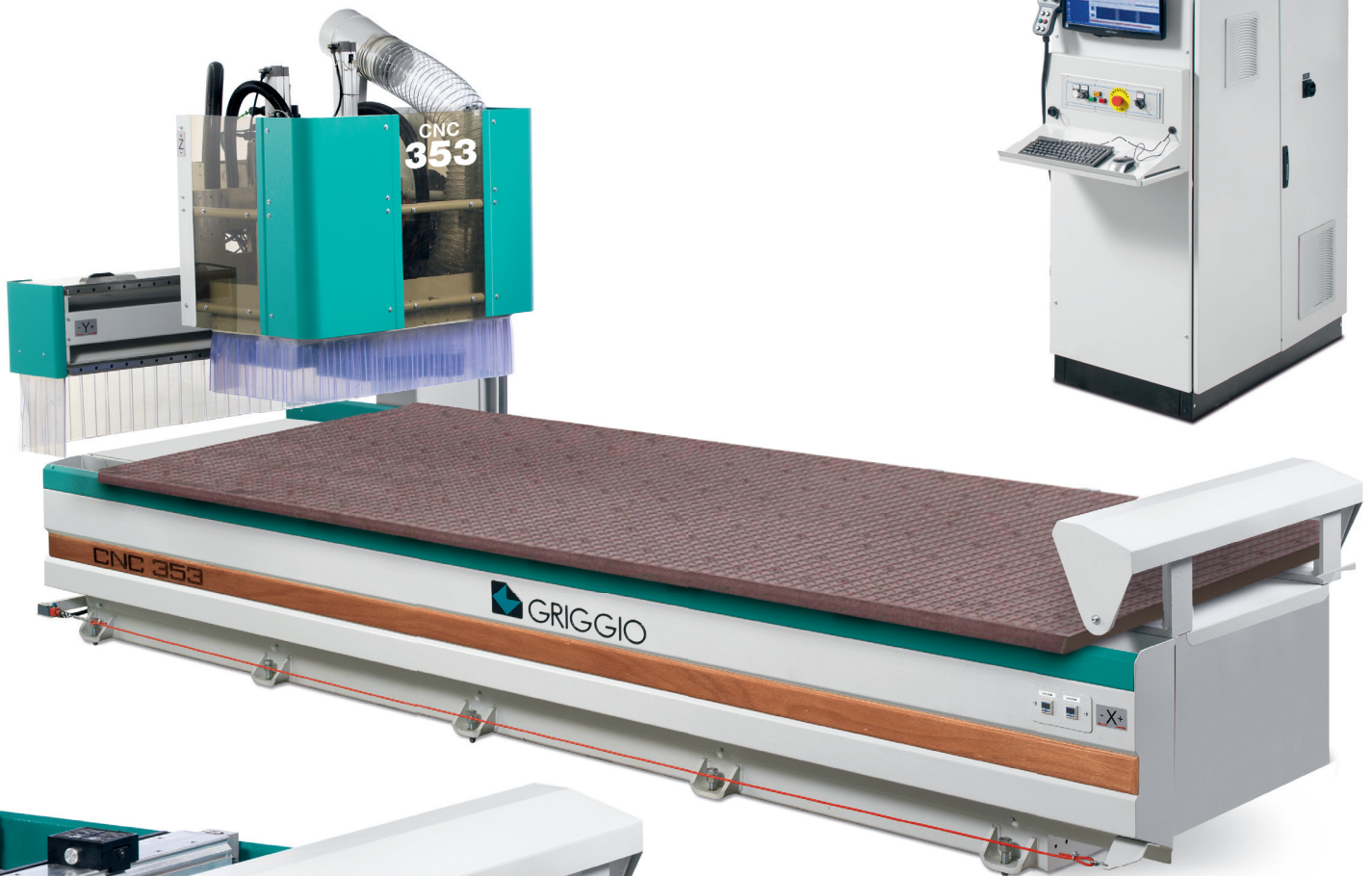
CNC 353 N