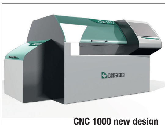
CNC 1000 new design